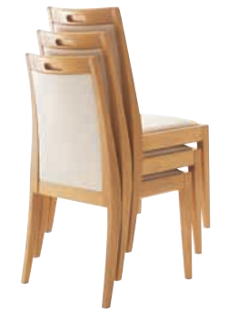
2 クレートン 5NA