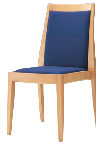
1 クレートン 5NA