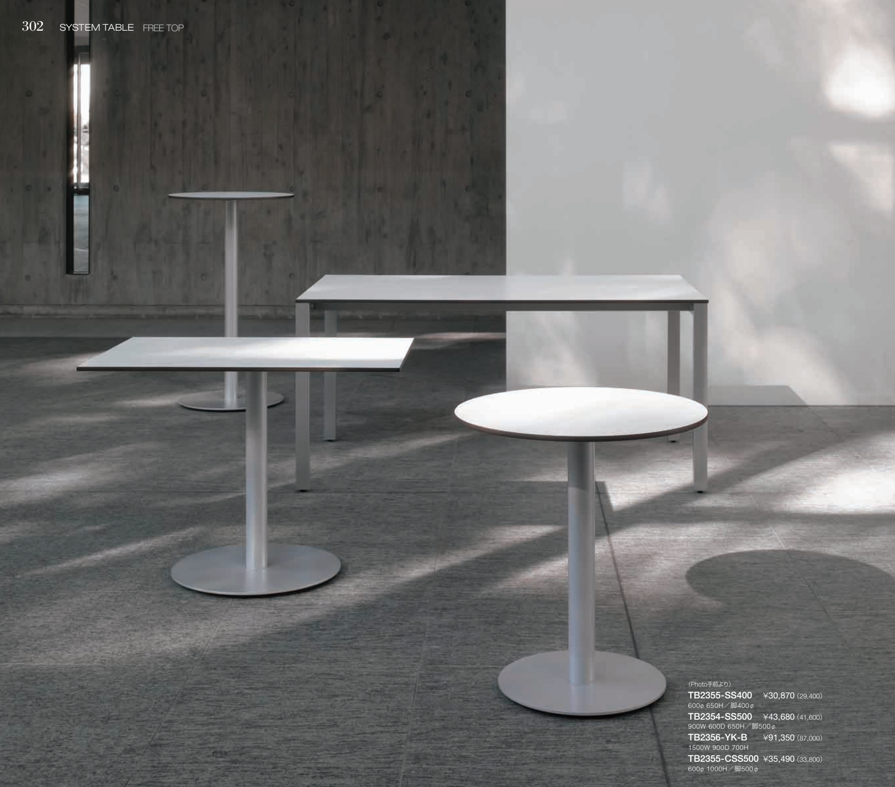
(Photo手前より) TB2355-SS400 ¥30,870 (29,400) 600φ 650H / 脚400φ TB2354-SS500 ¥43,680 (41,600) 900W 600D 650H / 脚500φ TB2356-YK-B ¥91,350 (87,000) 1500W 900D 700H TB2355-CSS500 ¥35,490 (33,800) 600φ 1000H / 脚500φ