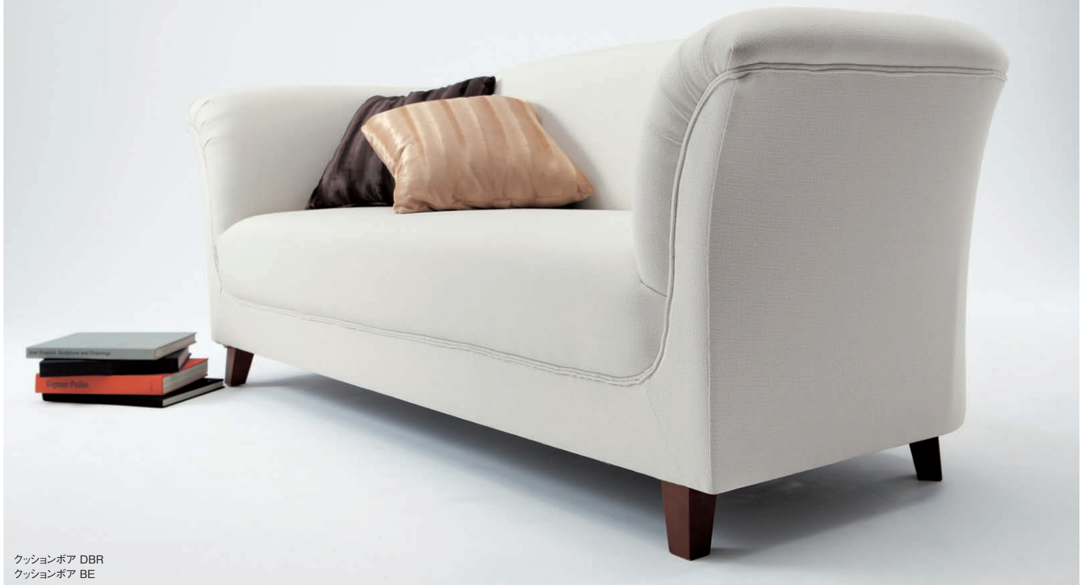
クッションボア DBR クッションボア BE