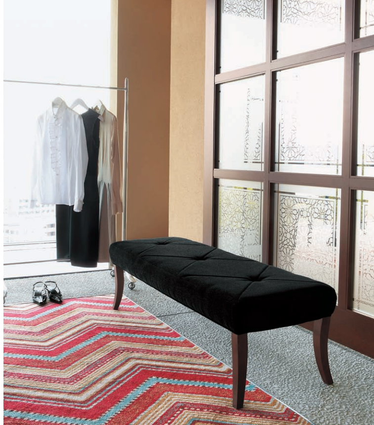
張地:D/布地・モナルダ06