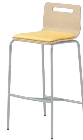
キーノカウンター-N 2D ¥28,455 (27,100) 張材:レザー-A-10 (No.40)