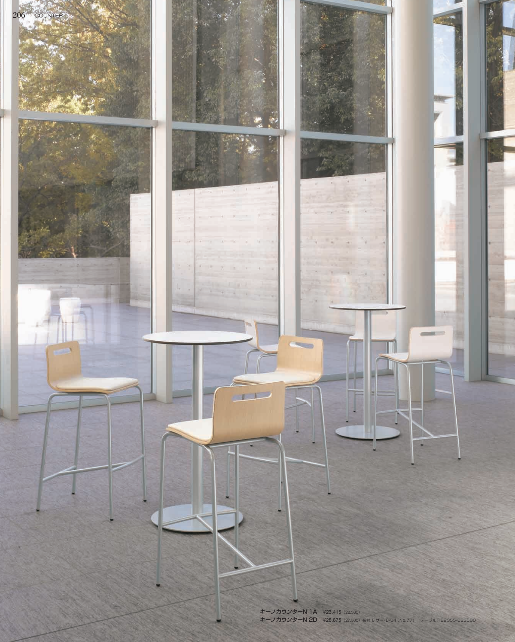
キーノカウンター-N 1A ¥23,415 (22,300) キーノカウンター-N 2D ¥28,875 (27,500) 張材:レザー-B-04 (No.77) テーブル:TB2355-CSS500