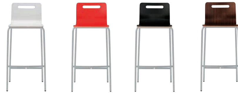
キーノ カウンター-N 1A