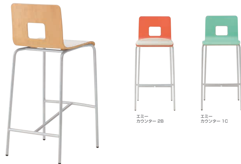
エミー カウンター-2B