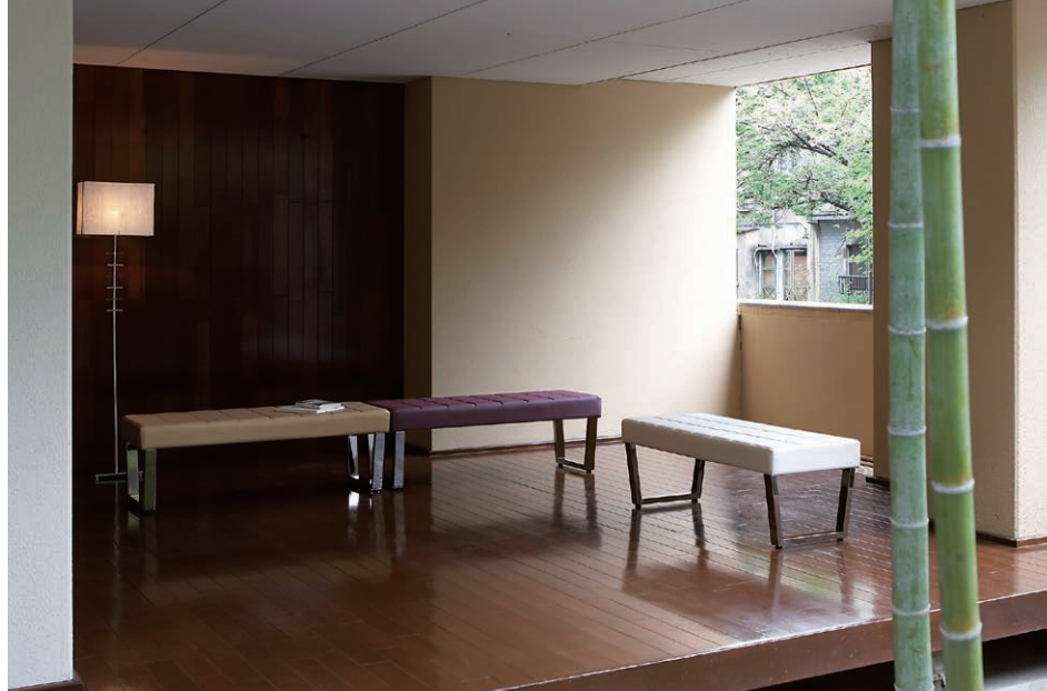
左:張地:C/レザー・マニエラL-8033 右:張地:C/レザー・マニエラL-8028