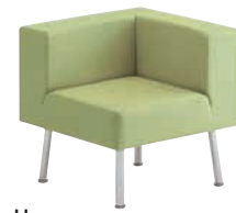
U 張材:レザー-B-70 (No.19)