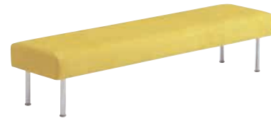
S 張材:布地-C-40 (カーキ)