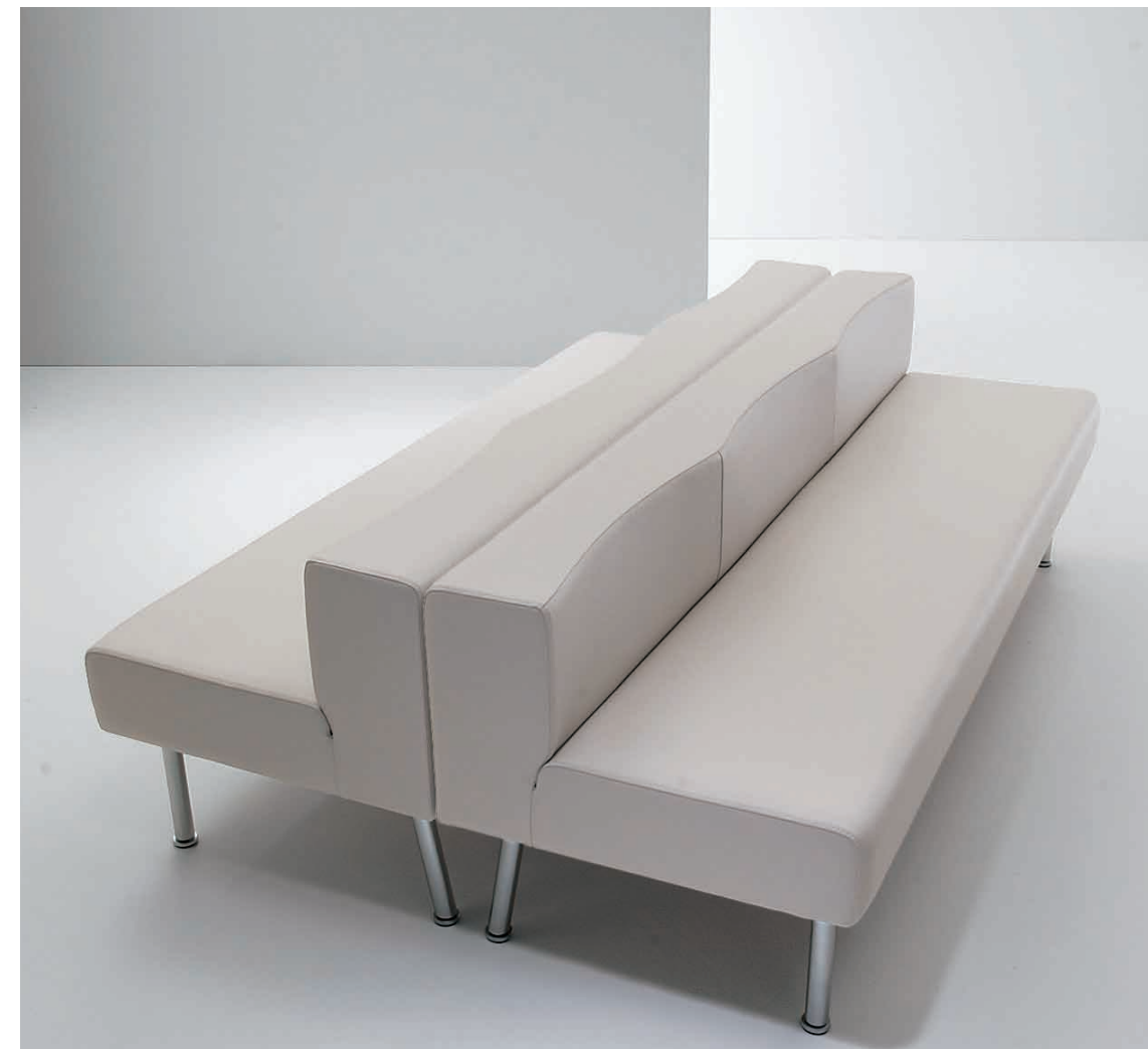
コパスE ¥113,400 (108,000) 張材:レザー-C-22(No.56)