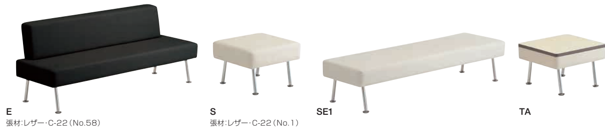
E 張材:レザー-C-22 (No.58)