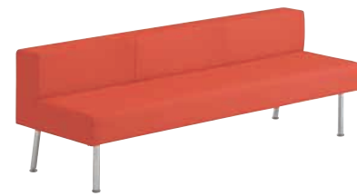
E 張材:レザー-B-04 (No.63)