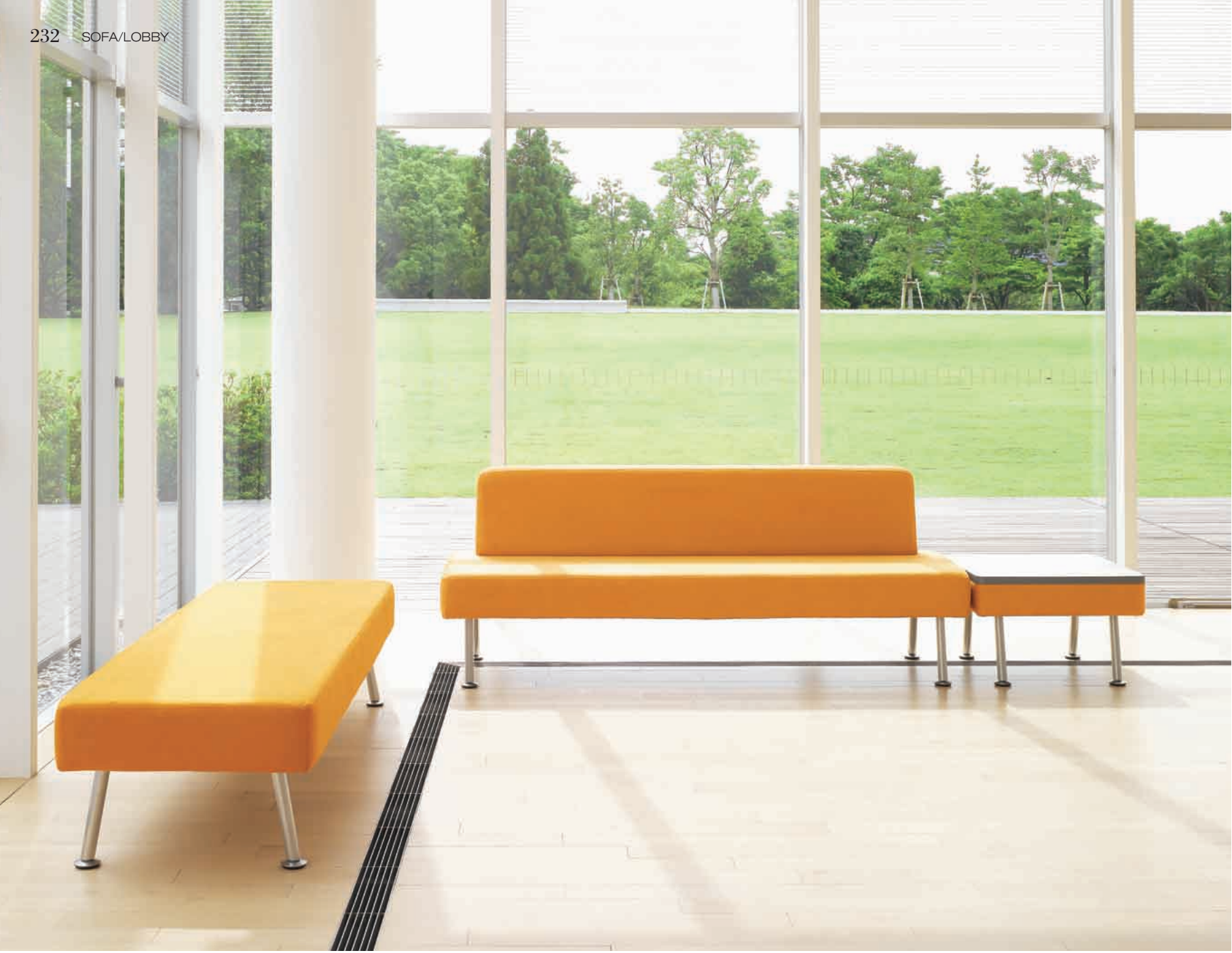
テリル SE1 ¥121,590 (115,800) テリル E ¥153,090 (145,800) テリル TA ¥77,175 (73,500) 張材:布地-C-40(イエローオレンジ)