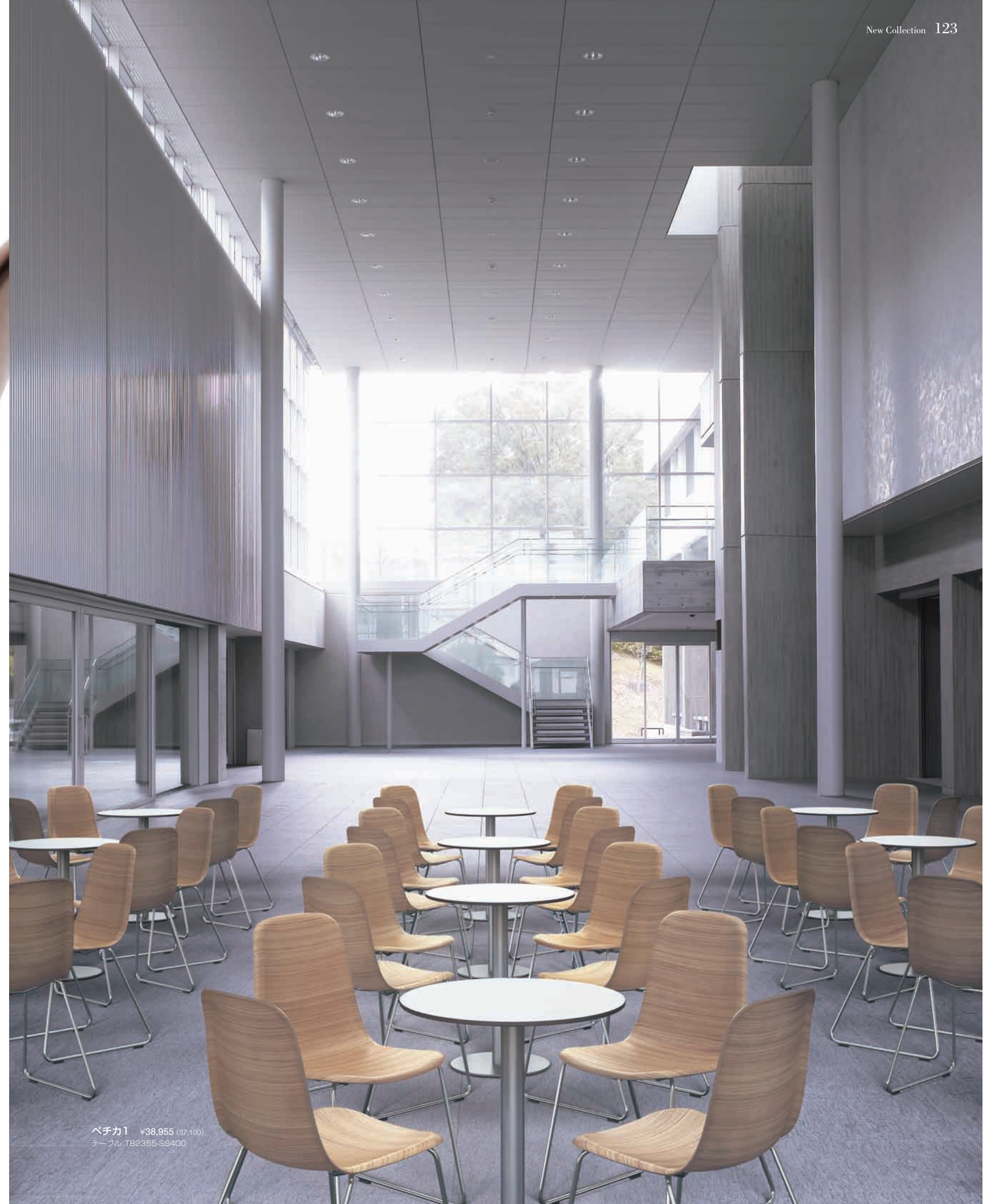
ベチカ1 ¥38,955 (37,100) テーブル: TB2355-SS400