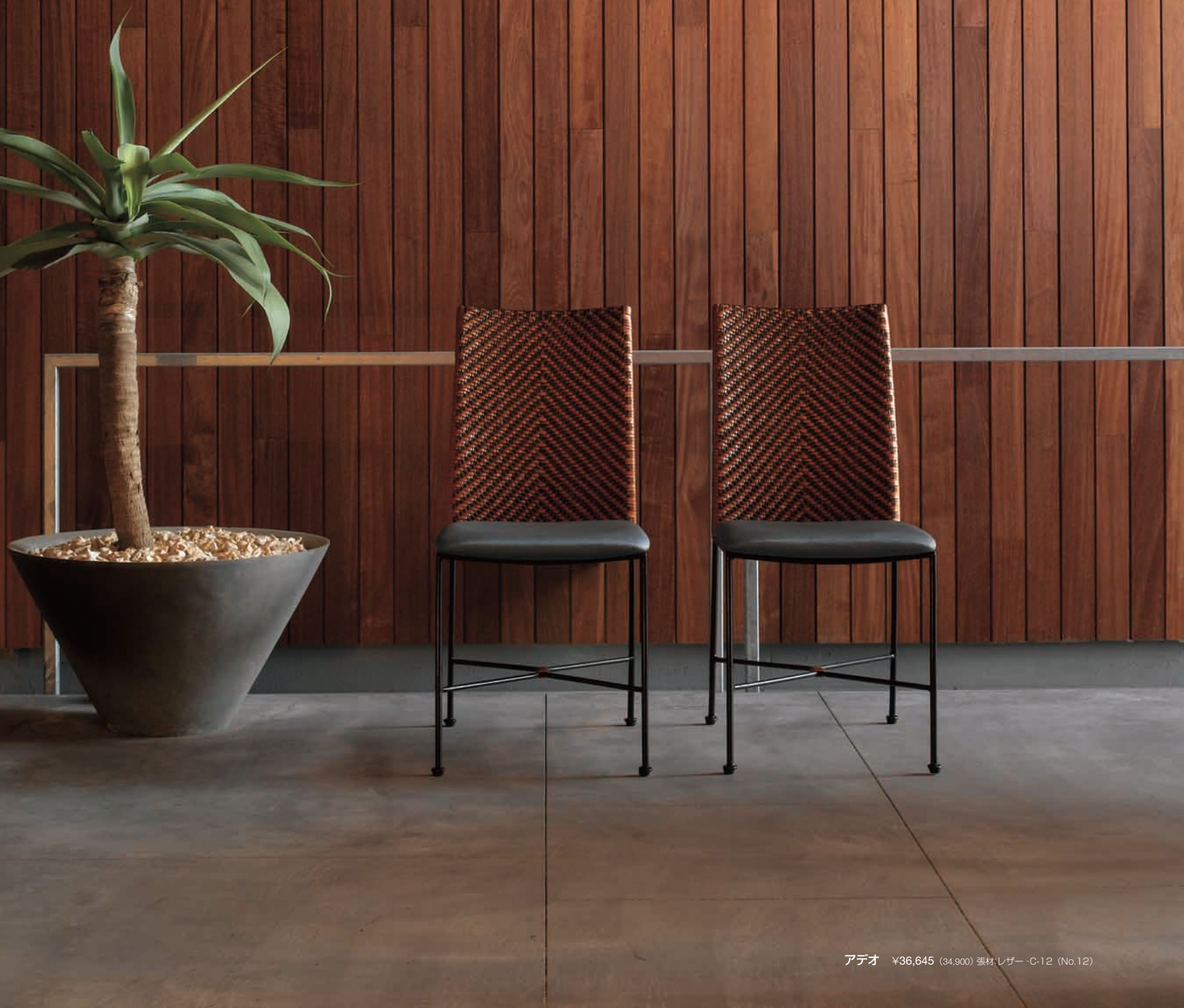
アデオ ¥36,645 (34,900) 張材:レザー・C-12 (No.12)